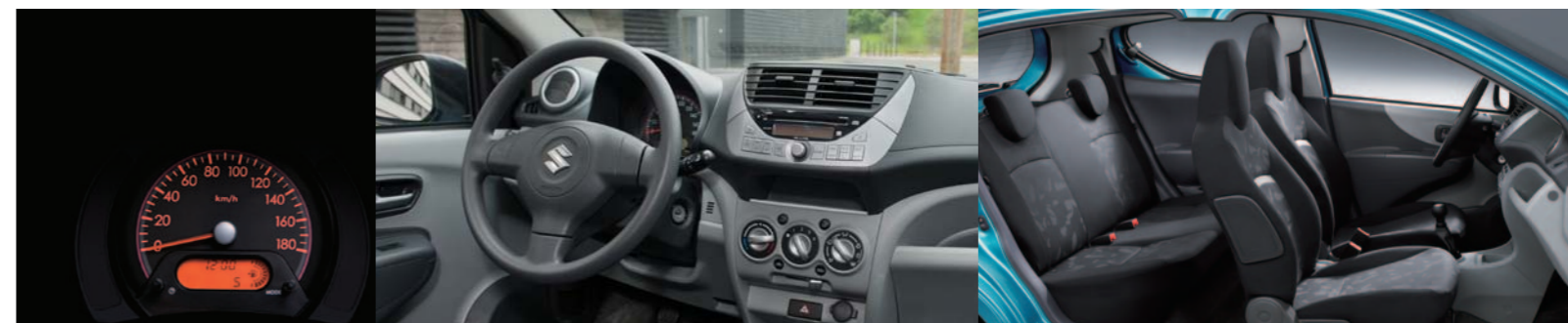
Consola (versões GL e GL Style)

O Alto dispõe de múltiplas soluções de arrumação e um painel de instrumentos simples e intuitivo.